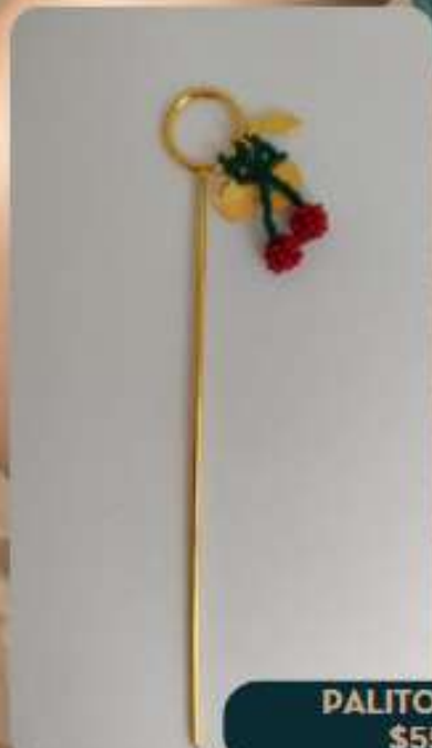
PALITO PRUNUS $55.900